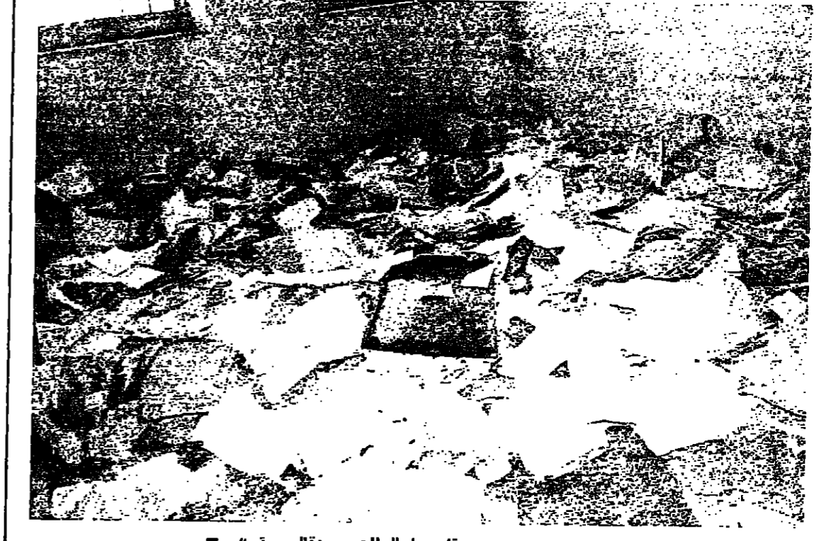
ممن بقاسا «الجريدة الرسمية»